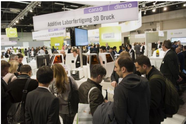
Abb. 2: Innovationen und neuer Unternehmensauftritt sorgten am Kulzer Stand für Trubel.